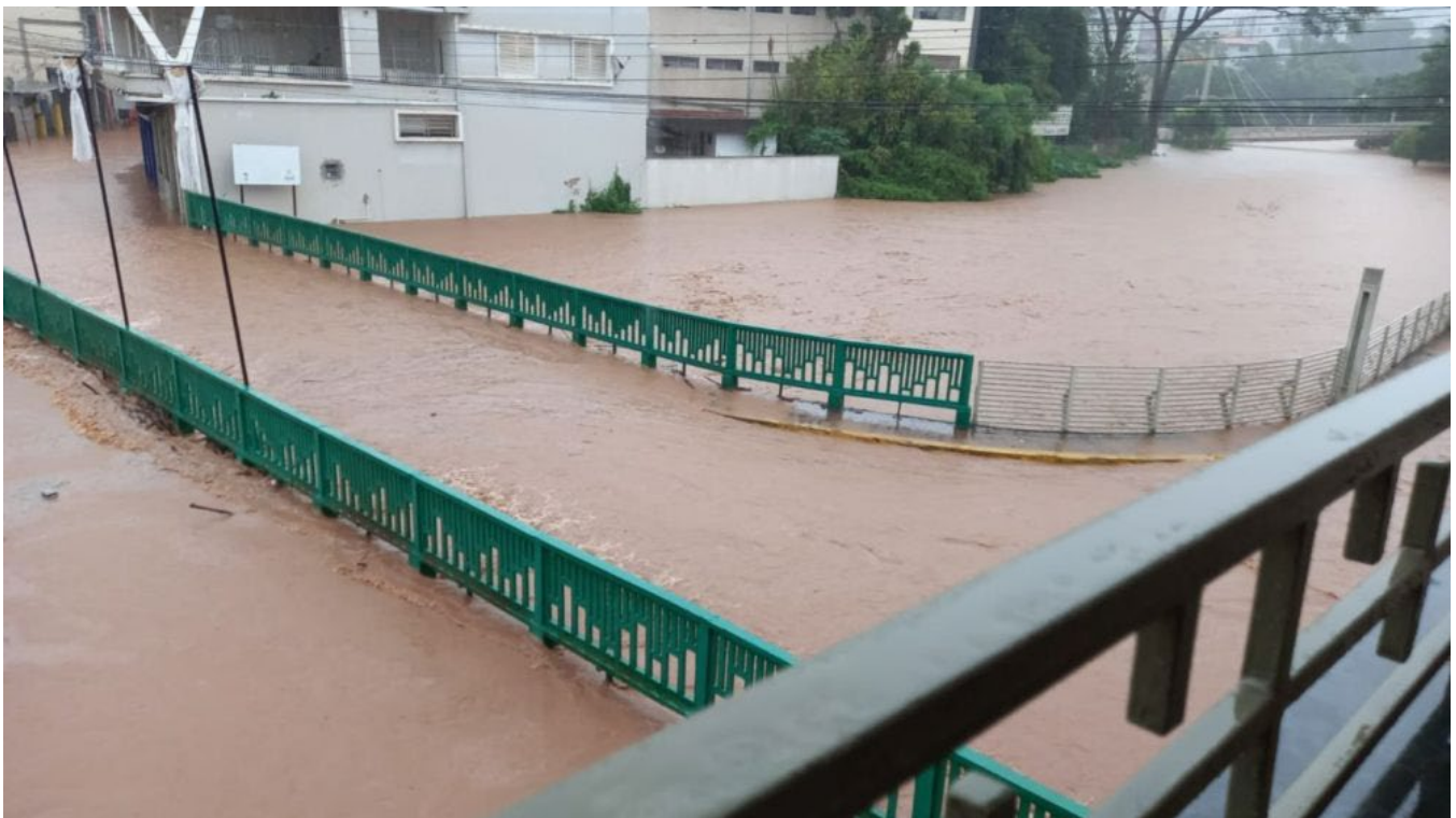
Figura 1: Enchente em Itabirito - 2022.

No ano de 2022, a cidade de Itabirito enfrentou desafios significativos devido às fortes chuvas e enchentes que assolaram a região. Diante desse cenário crítico, a Defesa Civil de Itabirito buscou soluções inovadoras para monitorar os níveis dos rios e afluentes locais, bem como os volumes de chuva, visando prevenir danos e proteger a população em situações de risco iminente.