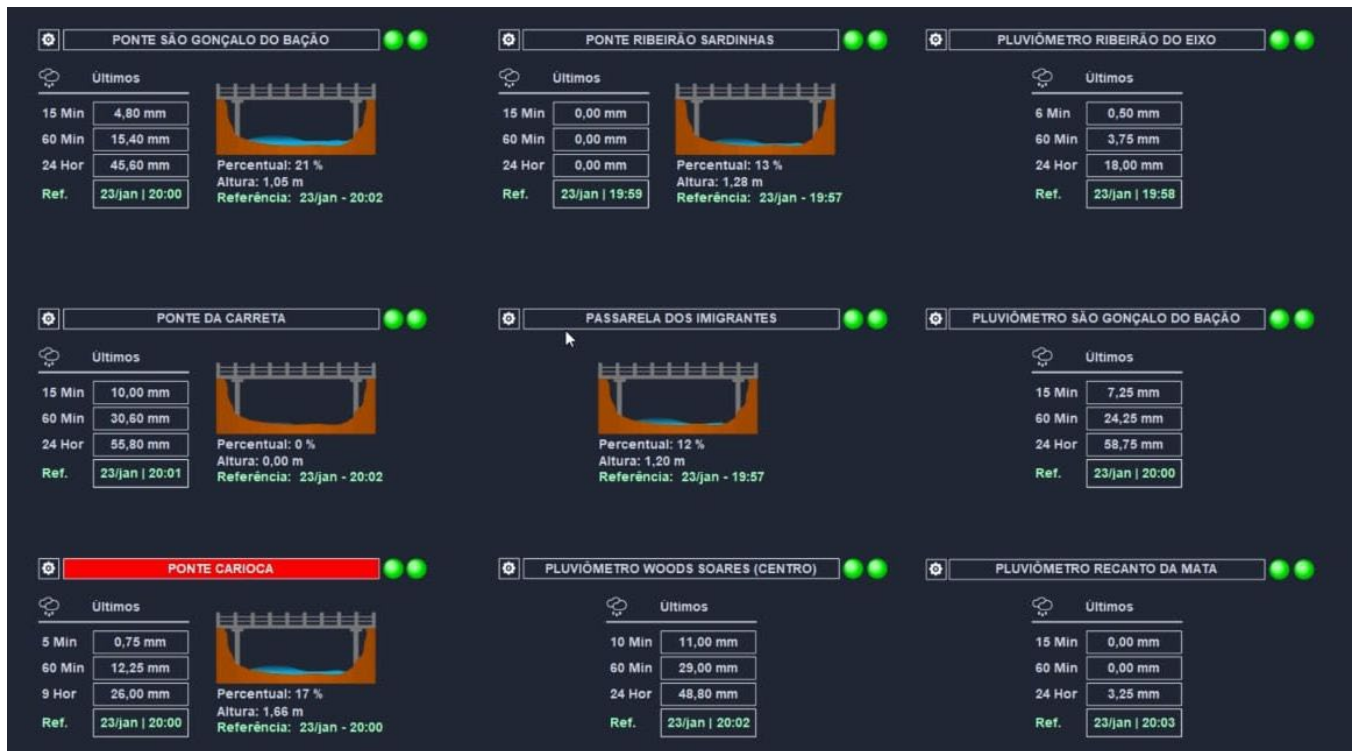
Figura 3: Monitoramento em tempo real de um dia chuvoso - Foto 1.