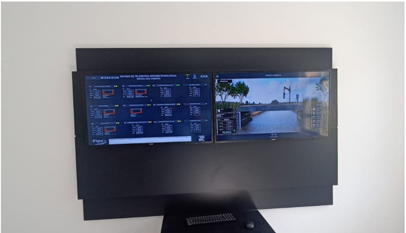
Figura 5: Estação de supervisão na sede da Defesa Civil.