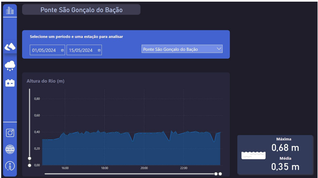
Figura 9: Análise gráfica dos históricos de níveis.