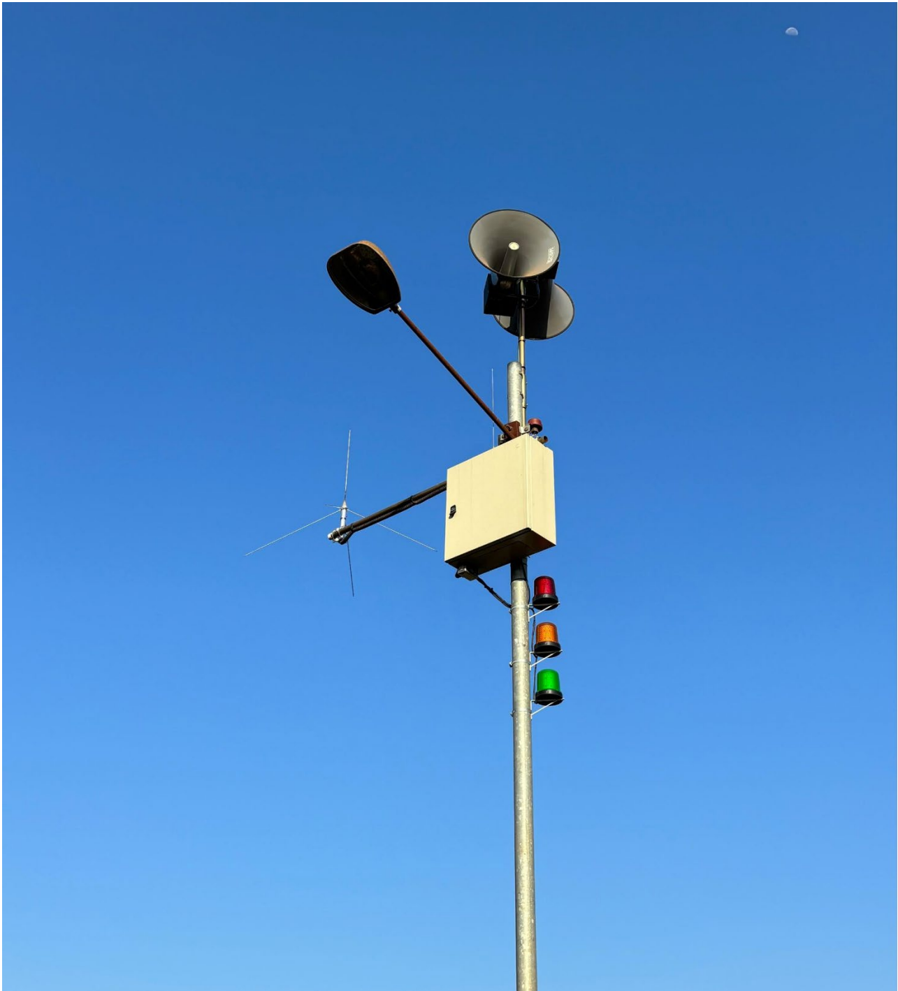
Figura 8: Sirenes e lâmpadas para alertar a população.

Além disso, o sistema é capaz de acionar remotamente sirenes e lâmpadas estrategicamente posicionadas na cidade, com o objetivo de alertar a população em diversas situações de acordo com as análises realizadas em tempo real pela equipe da Defesa Civil.