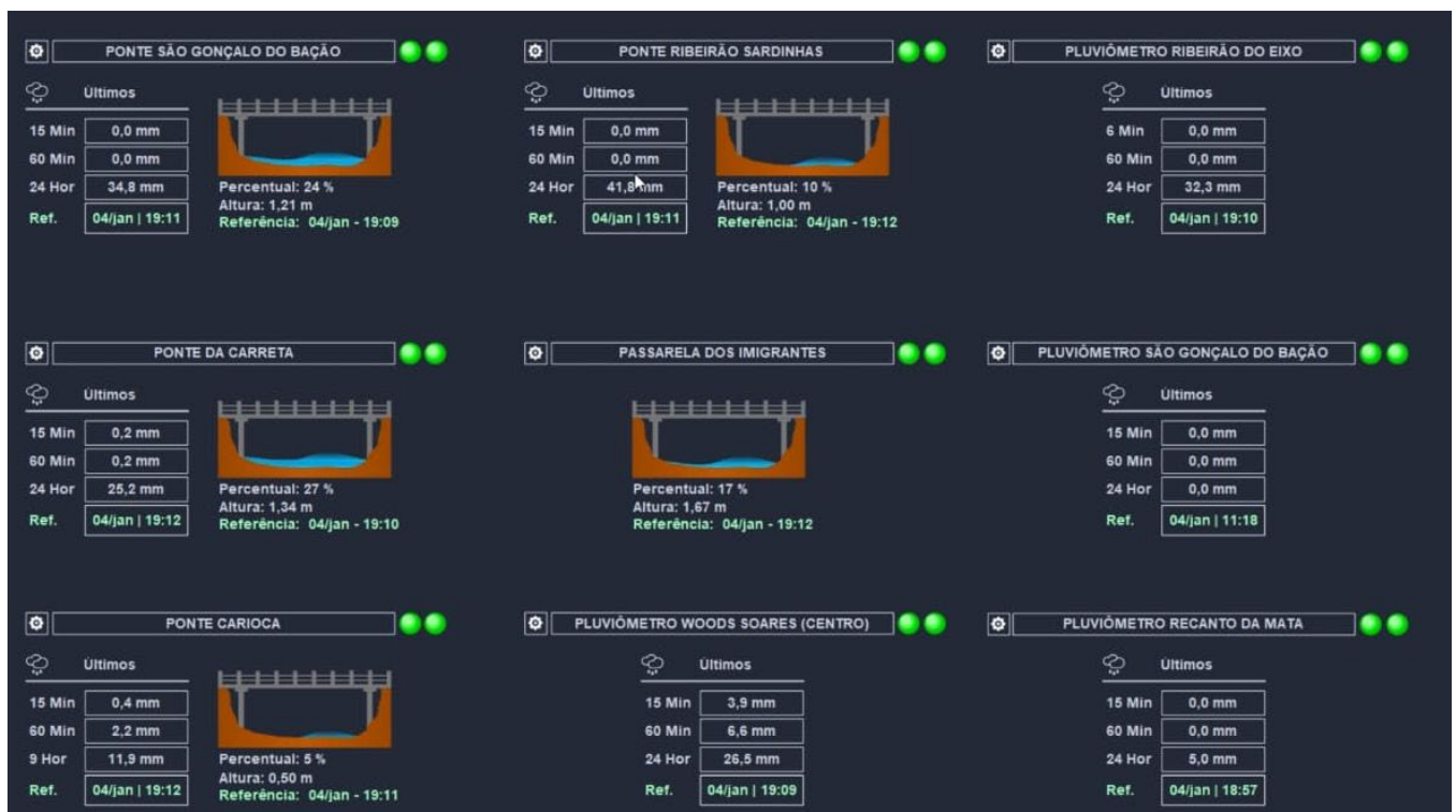
Figura 4: Monitoramento em tempo real de um dia chuvoso - Foto 2.