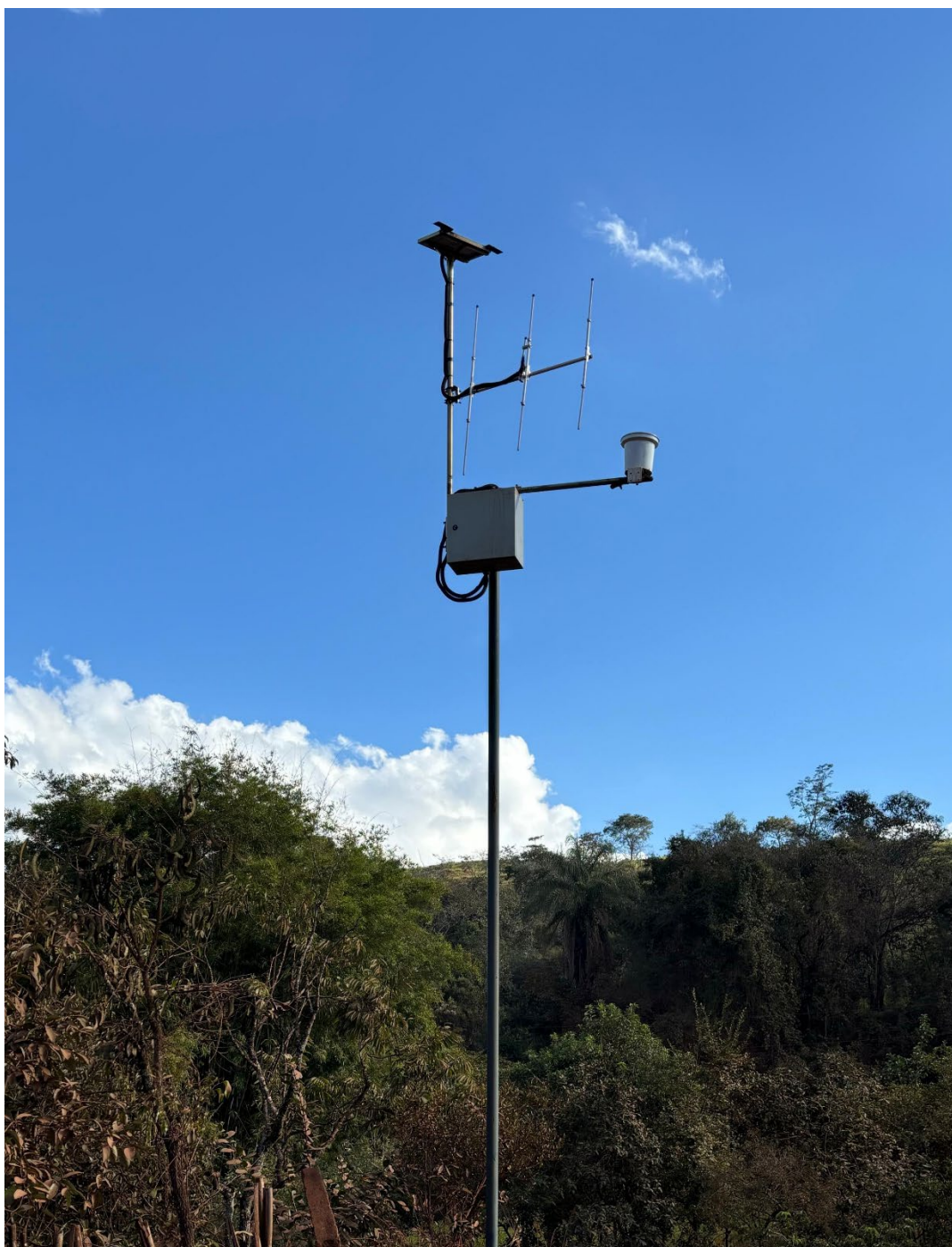
Figura 6: Estação de monitoramento hidro meteorológico.