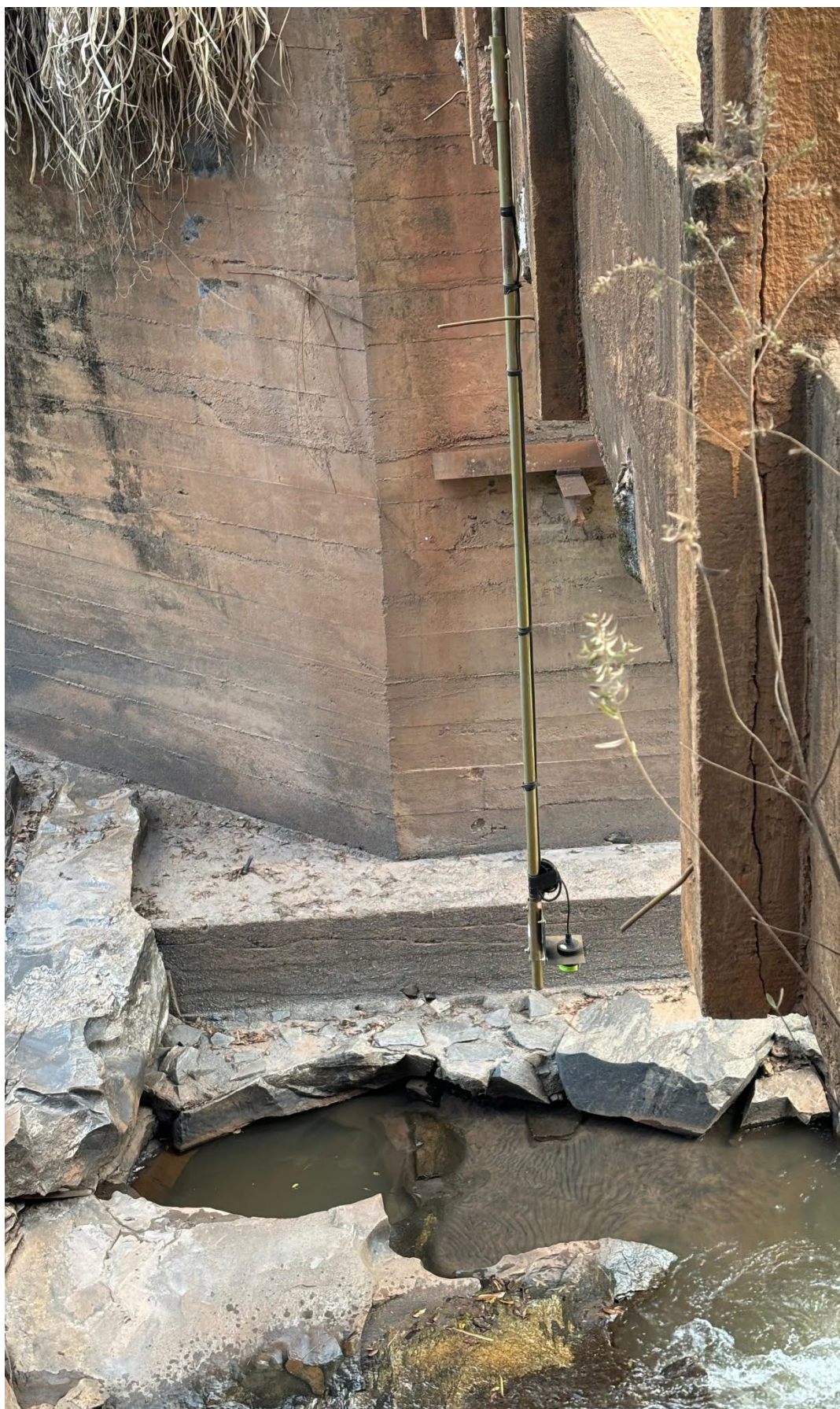
Figura 7: Monitoramento de nível de água com sensor ultrassônico.